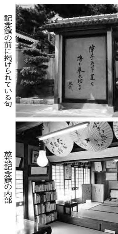
放哉記念館の内部

「争いのない生活」を求めて「無所有・奉仕」をなす俳句を作っています。東大震災の復讐の復興のため東京へ、また50人が、労働争議が頻発して地方に派遣され、残りの60人が鹿ヶ谷工場より京