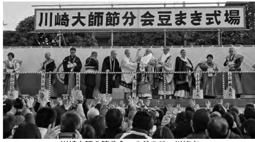
川崎大師節分分会豆まき式場

節分祭は、豆をまくことで厄払いをする。年男・年女が威勢よく豆まきをする。豆まきは、豆をまくことで厄払いをする。年男・年女が威勢よく豆まきをする。豆まきは、豆をまくことで厄払いをする。