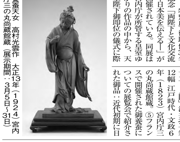
養蚕天女 高村光雲作 大正13年(1922)宮内庁三の丸尚蔵館蔵 展示期間:3月5日~31日

2・8独立宣言100周年記念式典が、日本韓国YMCAで執り行われた。式典には、両国の代表者が参加した。