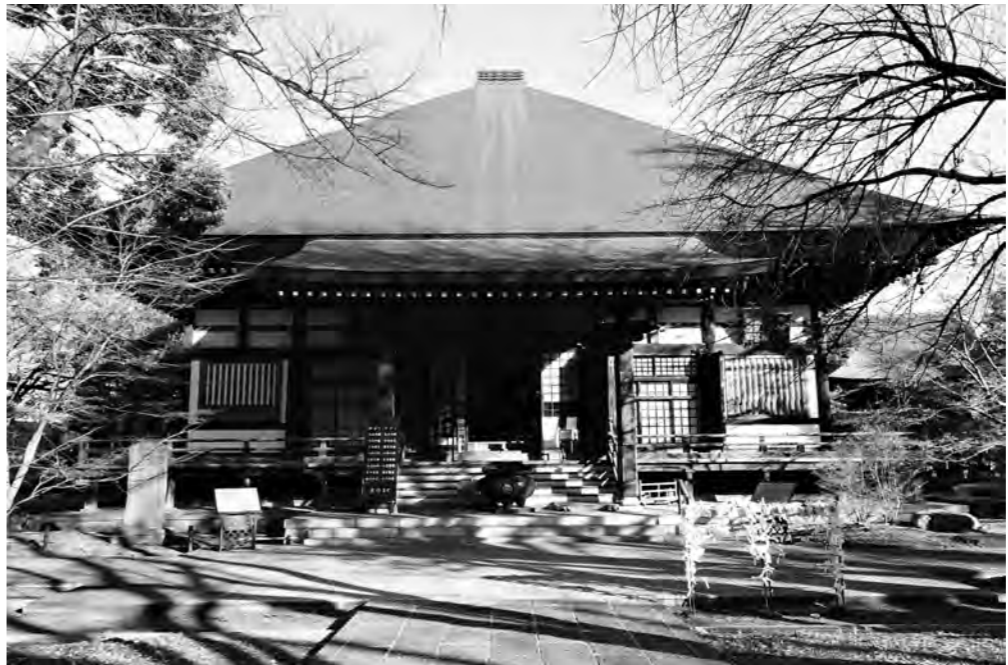
九品仏浄真寺 (東京都世田谷区)

正式名称は「九品山唯在念仏院浄真寺」で、浄土宗に属し「九品仏」の名で親しまれている。開山は江戸時代の初期の高僧珂碩(かせき)上人で、四代将軍徳川家綱公の治世の延宝6年(1678)に、奥沢城跡のこの地を貰い受け、浄土宗所依の經典である観無量寿經の説相によって堂塔を配置し、浄真寺を創建した。「江戸名所図絵」に描かれている堂塔の配置は現在とほぼ同じ。昭和40年に本堂・仁王門とも茅葺を銅板葺に改修した。 本堂には本尊、珂碩上人自作の釈迦牟尼如来が安置されている。同山第二世珂碩(かおく)上人代、元禄11年(1698)に三仏堂もども上棟した。雄大な茅葺の大殿で珂碩造りと言われた。浄真寺独特の行事「二十五菩薩来迎会」(略称「お面かぶり」)は、本堂(此岸)と三仏堂中央の上品堂(彼岸)との間に橋をかけ、阿弥陀仏と二十五菩薩が、来迎・往生・遊來(げんらい)と3回橋を行道するもの。東急大井町線九品仏駅から徒歩2分。