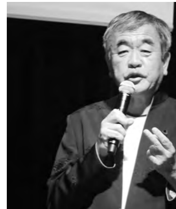
隈研吾氏の講演「木の建造物」。

バチカンと中国が歴史的合意を結ぶことについて、その是非を問う。合意がもたらす影響と課題について話し合った。